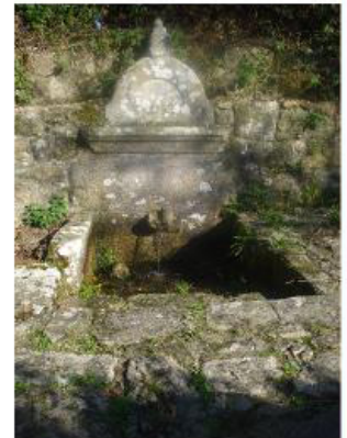
Fonte de Santa María de Morquintián