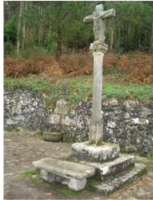
Cruceiro de Morquintián