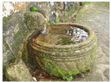
Fonte do cruceiro, Morquintián

A fachada presenta unha porta que ten un arco de medio punto moi rebaixado. Na parte alta da fachada practícase unha grande abertura para un óculo. O piñón aparece rematado polos restos dun Agnus Dei delatado e, sobre el, unha cruz antefixa calada nun bloque de pedra, ben conservado.